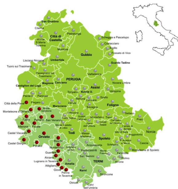
L'area interna Sud Ovest Orvietano e i Comuni interessati

L'area interna dell'orvietano è composta da 20 comuni situati geograficamente a cerniera tra Umbria, Toscana e Lazio, la superficie interessata è pari a 1.187 kmq con una densità della popolazione medio-bassa pari a 52,7 abitanti per Kmq, circa la metà del valore medio regionale pari a 104,5. Il territorio è ricompreso al 100% nelle aree interne.